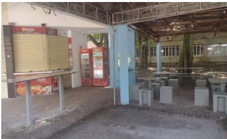
Cantina IF IQB II