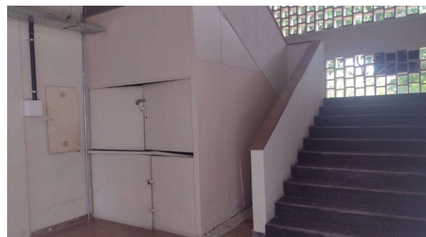
FEAC (BLOCO 14)