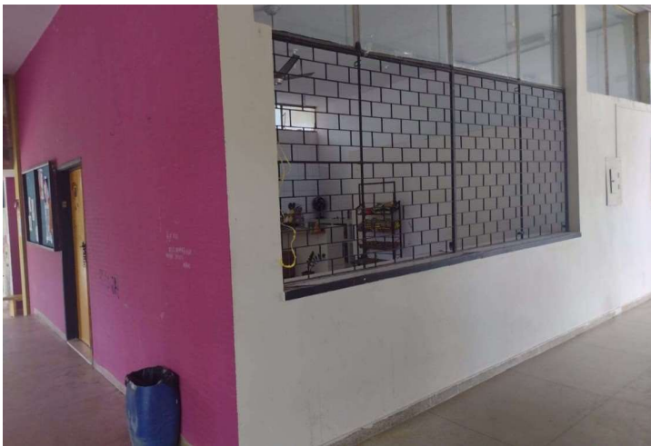
Cantina - ICHCA