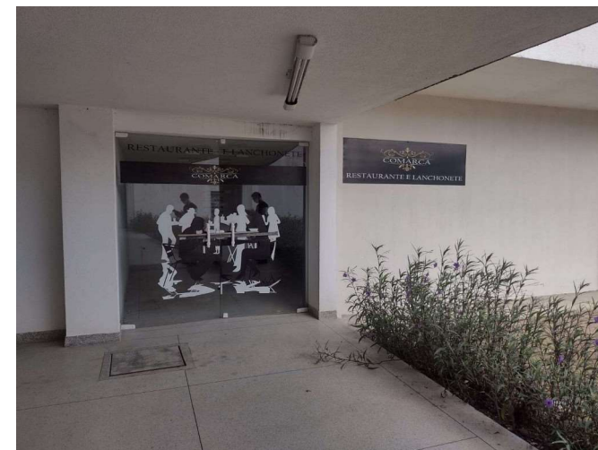
Restaurante – FDA