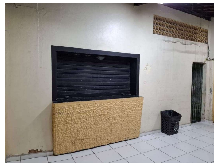
ESPAÇO CULTURAL (PRAÇA SINUMBÚ)