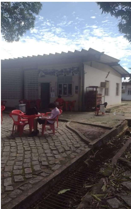
Cantina – COS (Próximo ao CTEC)