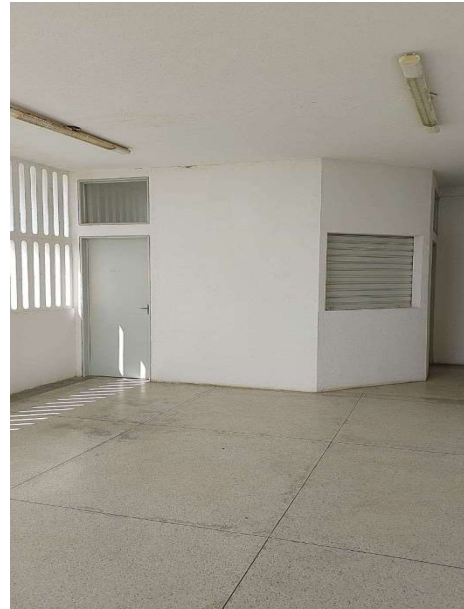
Cantina - FALE