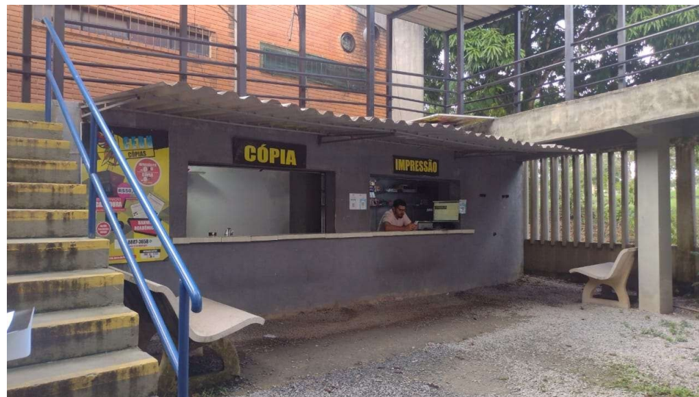
CEDU – ESPAÇO 1