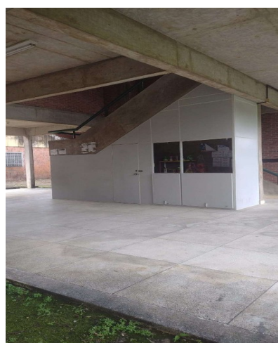
EENF (ANTIGO ESENFAR)