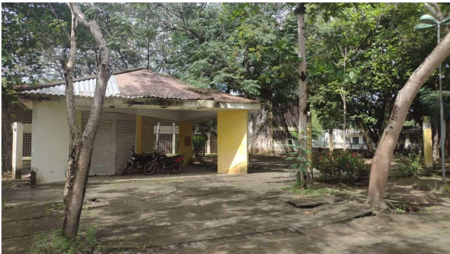
Cantinas – FEAC II (LADO DIREITO)