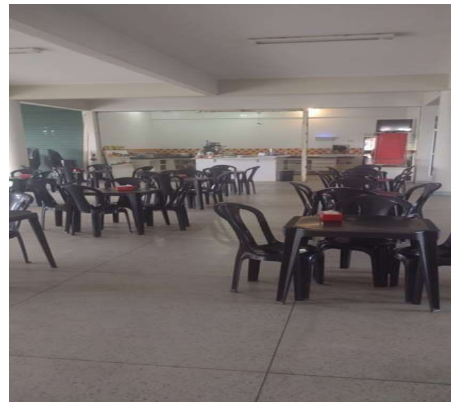
Restaurante CIC II