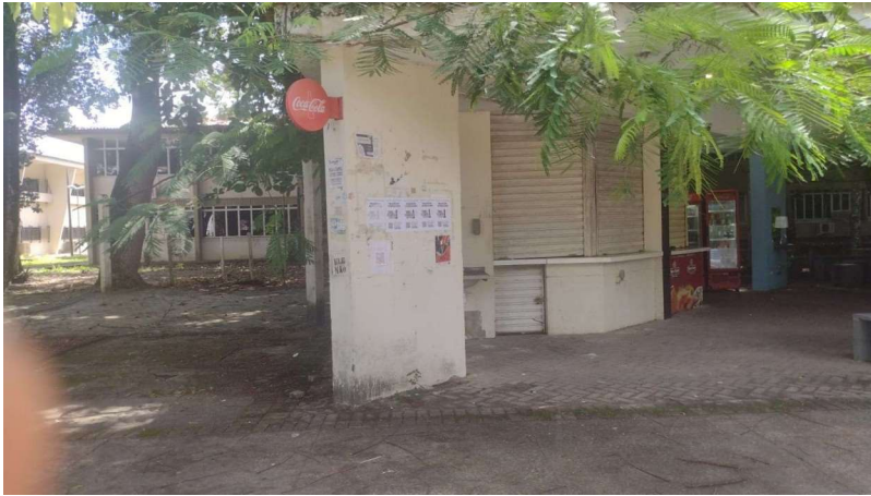
Cantina IF-IQB I