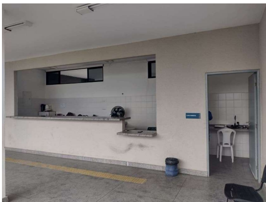
Cantina – Lado direito (Estádio Universitário)