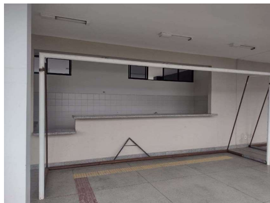
Cantina – Lado esquerdo (Estádio Universitário)