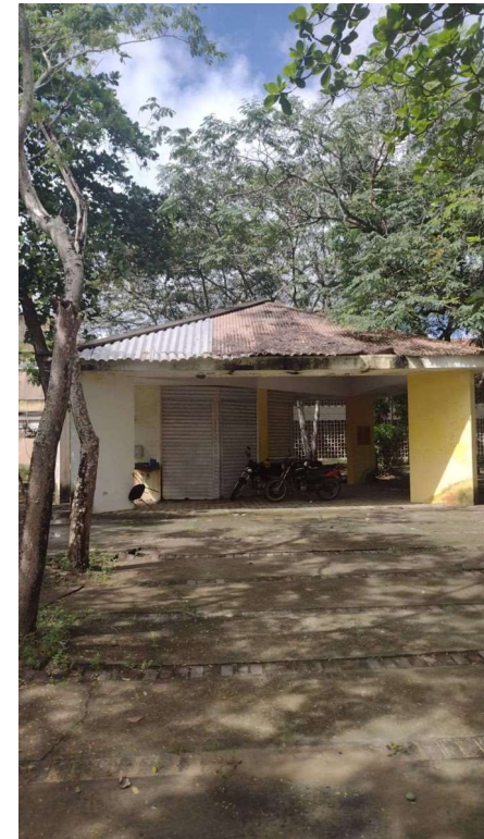
Cantinas – FEAC I (LADO ESQUERDO)